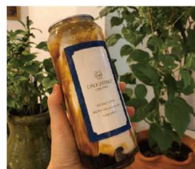
밀크티 & 버블티