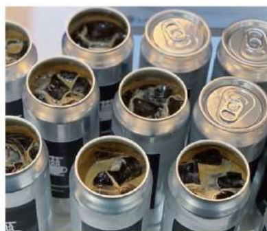
수제 캔 커피