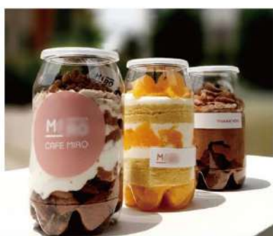
컵케익 & 디저트류