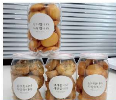
쿠키 & 식품류