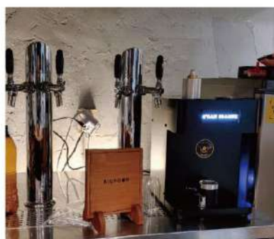
수제 & 생맥주 판매점