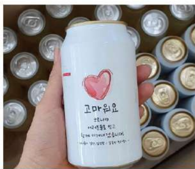
메세지캔 & 답례품