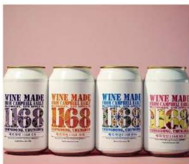
와인 & 수제맥주