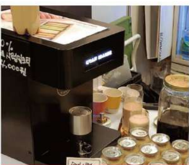
밀크티 & 버블티 판매점