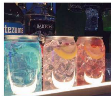
카테일 & 주류