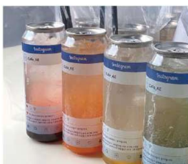
에이드 & 탄산음료