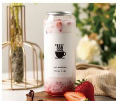
생딸기우유 & 요거트